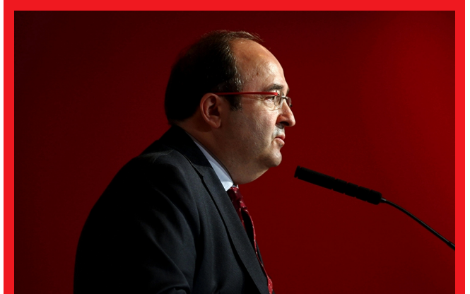
El líder del PSC, Miquel Iceta

El líder del PSC, Miquel Iceta, ha dicho hoy que el "mayor problema" del expresident Artur Mas no es su inhabilitación sino que lo que "le está haciendo más daño" es el caso Palau de la Música, y ha advertido de que la sentencia del 9N muestra que "el camino de saltarse la ley no lleva a ningún sitio". Tras la sentencia condenatoria a Mas y las exconselleras Joana Ortega e Irene Rigau por desobedecer al Constitucional con la consulta