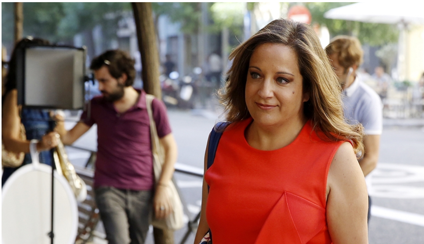
La eurodiputada socialista Iratxe García

BRUSELAS / 1 mes sin dietas, 10 días de suspensión y la prohibición de representar a la Eurocamara durante un año. El Parlamento Europeo ha impuesto una sanción sin precedentes al diputado polaco Janusz Korwin-Mikke por interpelar a la eurodiputada Iratxe García para decir que las mujeres "deben ganar menos porque son más débiles y menos inteligentes.