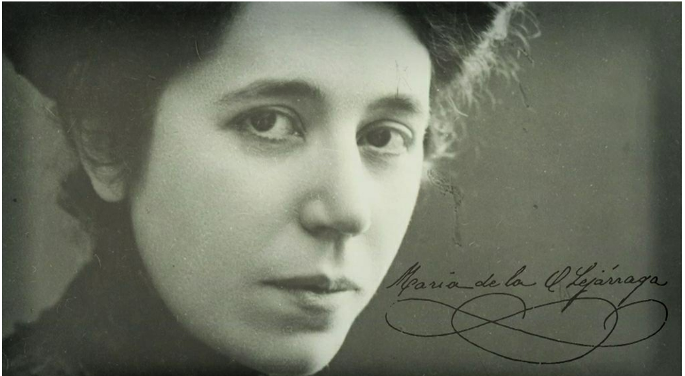
María de la O Lejárraga García.