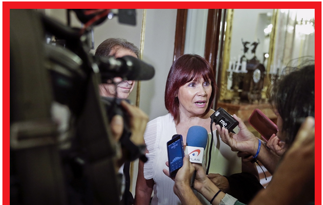
La vicepresidenta segunda de la Mesa, la socialista Micaela Navarro

La vicepresidenta segunda de la Mesa, la socialista Micaela Navarro, ha explicado que el PSOE ha pedido al Congreso que rechace el veto del Gobierno a la proposición de ley sobre el autoconsumo eléctrico apoyada por toda la oposición, ya que no tendrá efectos en el presupuesto de 2017, sino en el de 2018. Así, el PSOE ha presentado un escrito pidiendo a la Mesa del Congreso que se tramite dicha proposición de ley, y será el