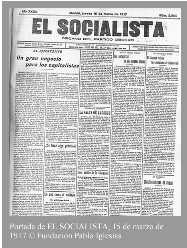
Portada de EL SOCIALISTA, 15 de marzo de 1917