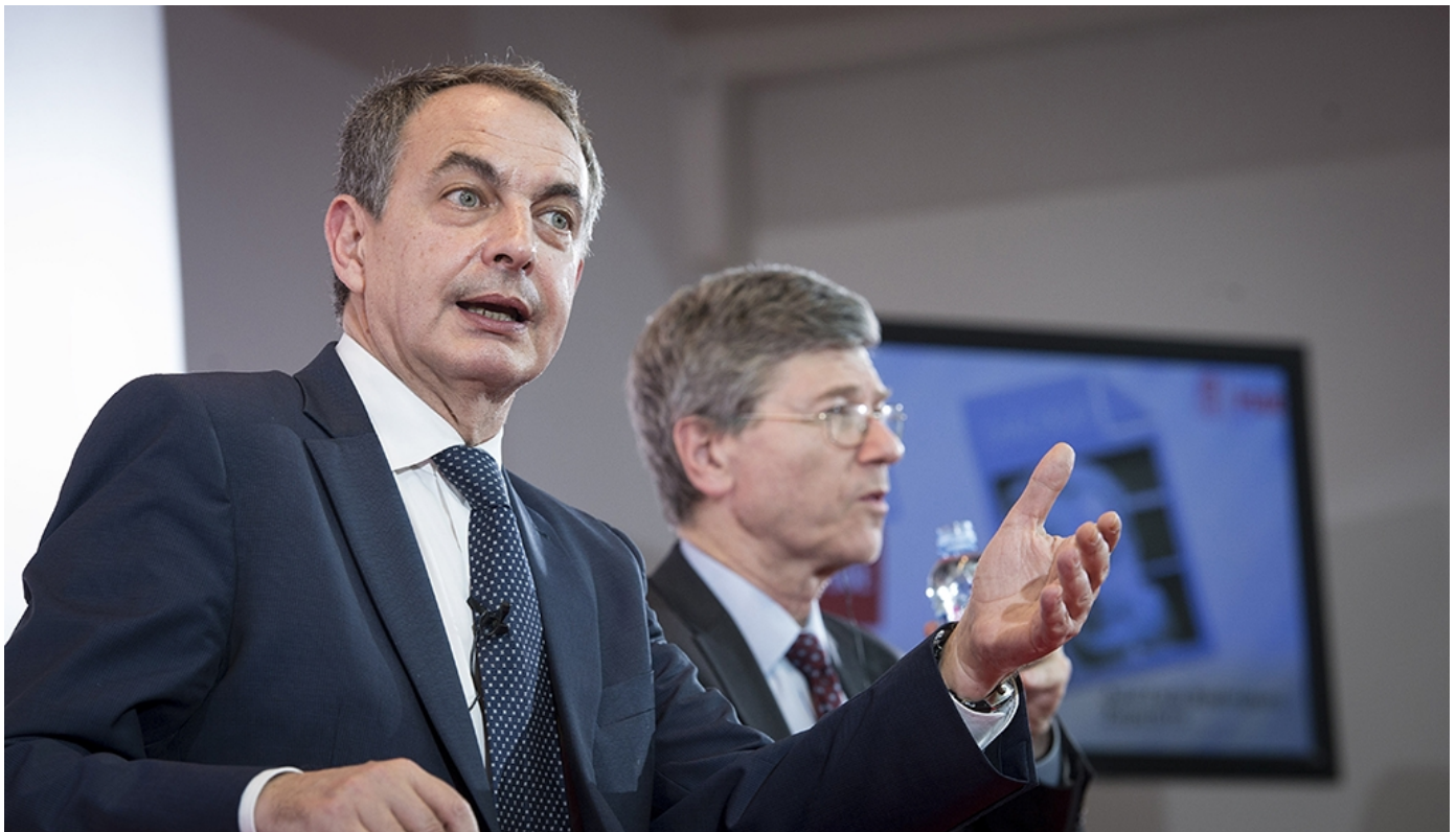
El expresidente José Luis Rodríguez Zapatero (i) y el economista, catedrático de la Universidad de Columbia y director de la Red de Soluciones de Desarrollo, Jeffrey Sachs (d)

En el acto, que ha coincidido con el 13 aniversario de su primera victoria electoral, Rodríguez Zapatero ha defendido que los socialistas "somos la fuerza política que más transformaciones democráticas y sociales, de progreso, hemos logrado". La que "más ha cambiado la historia en España, en Europa y también en EE.UU., de la mano de los liberales", como se autodenominan.